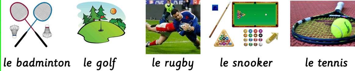
le badminton le golf le rugby le snooker le tennis