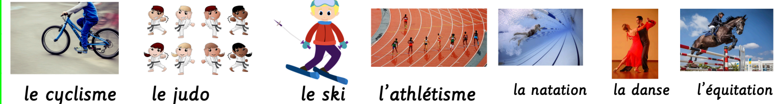
le cyclisme le judo le ski l'athlétisme la natation la danse l'équitation

lundi mardi mercredi jeudi vendredi samedi dimanche