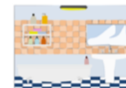
une salle de bains

Qu' est-ce qu'il y a dans ta chambre? / What is in your bedroom?