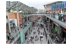
le centre commercial